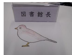
教育長と図書館長の作品