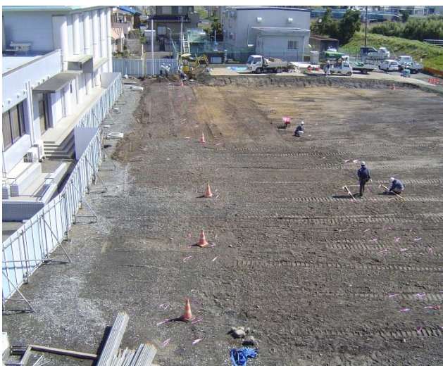
4/1 まっさらの更地になりました。これから地震に負けないよう地盤改良工事を行っていきます。