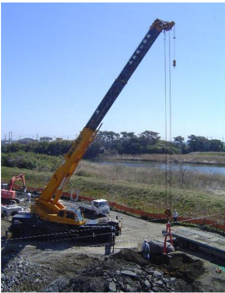
3/26 公園にあった石碑を移設します。

そして、ニュースでご覧になった方もいらっしゃるかもしれませんが、4月7日に安全祈願祭が行われました。多くの人たちがこれから約1年間作業をされる現場です。事故などのないよう無事完成の日を迎えたいものです。