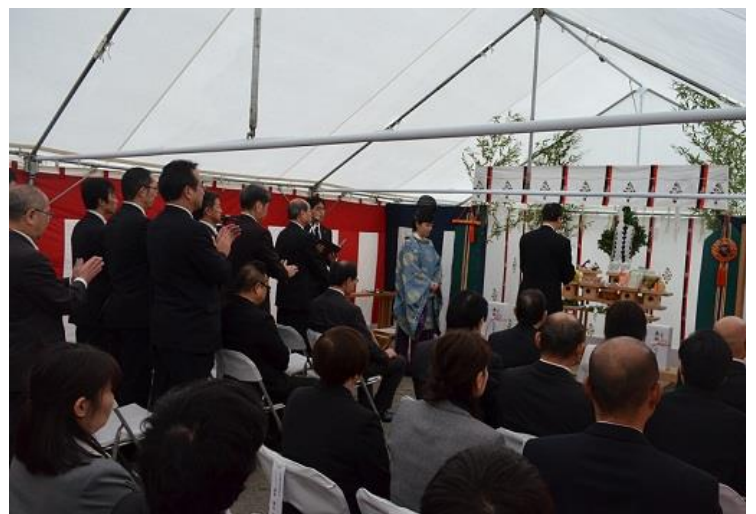
4/7 安全祈願祭を行いました。無事に工事が完了しますように……。