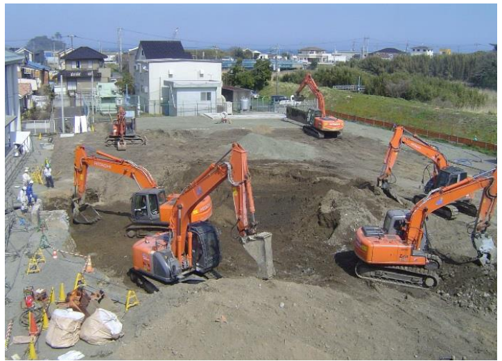
3/31 ショベルカー6台稼働中！