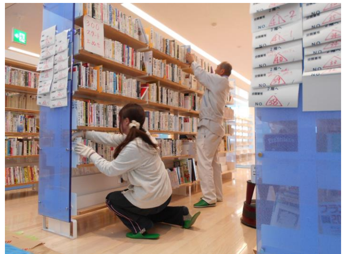
2階の一般書の書架にどんどん本を入れていきます。入れたい抜いたい、調整が大変です。