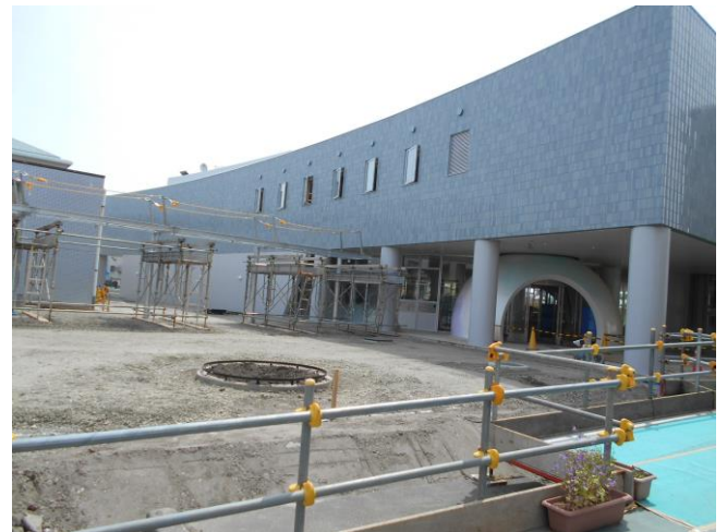
5/9 外構工事も進行中です。ふれあいセンターと図書館が渡り廊下でつながります。これで雨の日でも大丈夫。