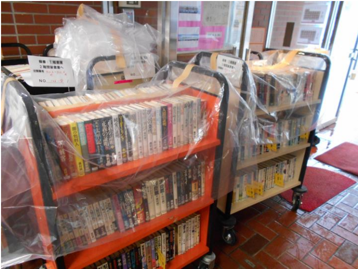
雨の日はビニールでカバーをして本を運びます。人は濡れても、本は濡らしません。

いよいよ開館まであと1ヶ月を切りました。この雑然とした館内が本当に片付くのでしょうか!? いや、片付く、じゃないですね。片付ける、しかないのです。がんばります!