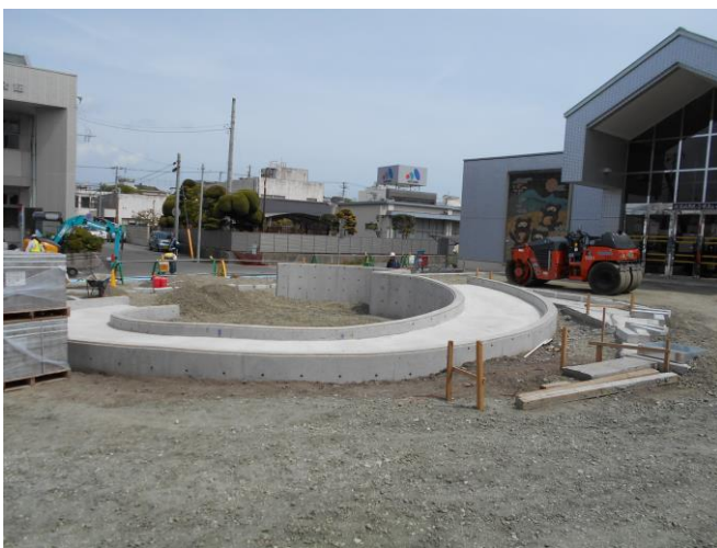
バリアフリー化に向け、スロープも整備しています。