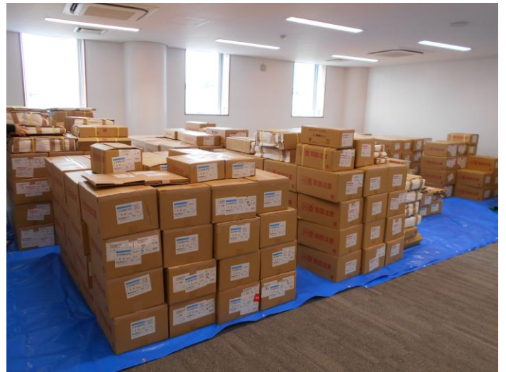
4/5 新しく買った約2万冊の本が届きました。全部開けて、ICタグを貼って、本棚に差し込んで...