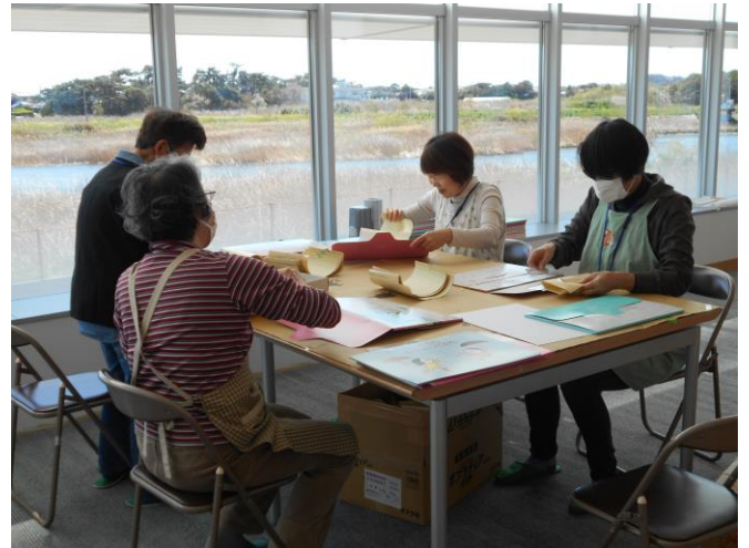
新しい紙芝居をカバーフィルムで補強します。