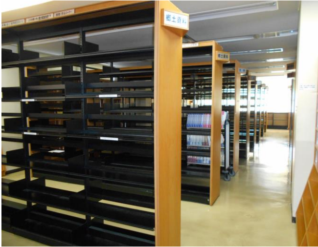
4/12 旧館1階。ほぼ空っぽになりました。