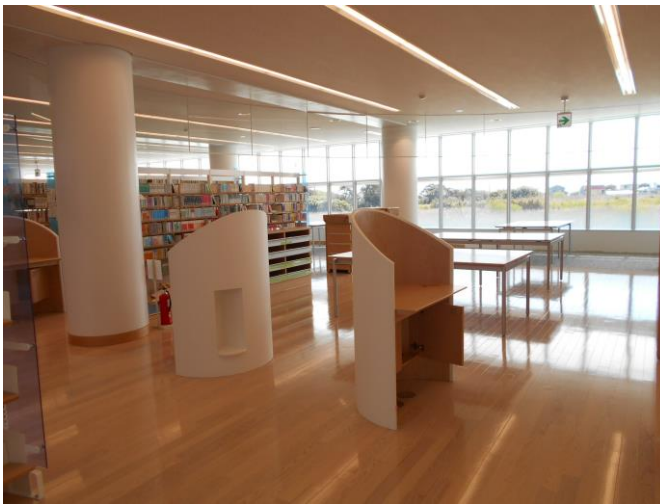
2階はそれっぽくなってきました。この丸っこいのは、利用者用パソコンを設置する予定です。