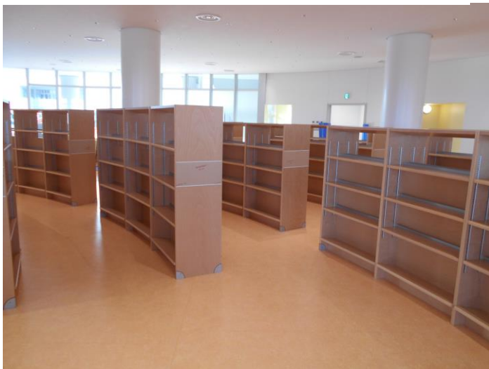
1階の児童書架も出来上がってきました。建物に合わせた曲線仕様です。