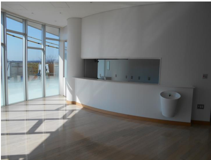
カフェはこちらです。コーヒーの香りがただよってきそう。