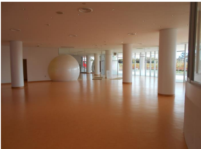
1階はまだ広々。書架はこれから入ります。 授乳室の球体がすごい存在感です。

さて、新図書館の引渡しまでもう少し。図書館も休館期間に入り、急ピッチで引越しの準備が進んでいます。筋肉痛にならないよう、今のうちに少し運動をしておかないといけな いかもしれません。(3月22日撮影)