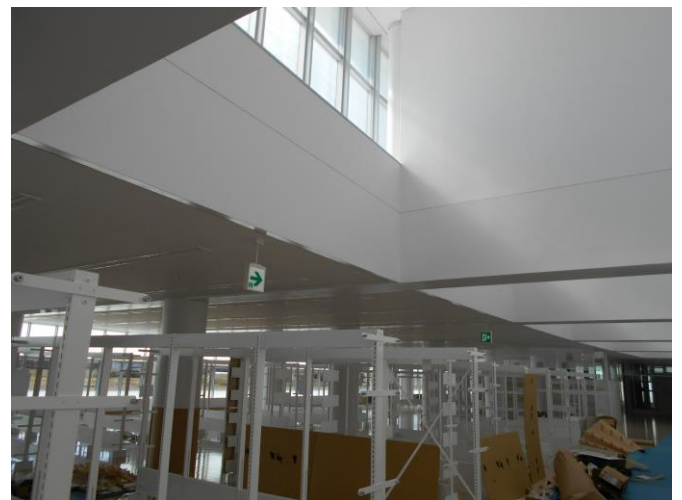
2階は天井に明り取りの窓があるので、電灯がついて なくてもとても明るいです。